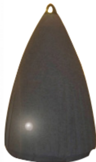
Borne Dass RF